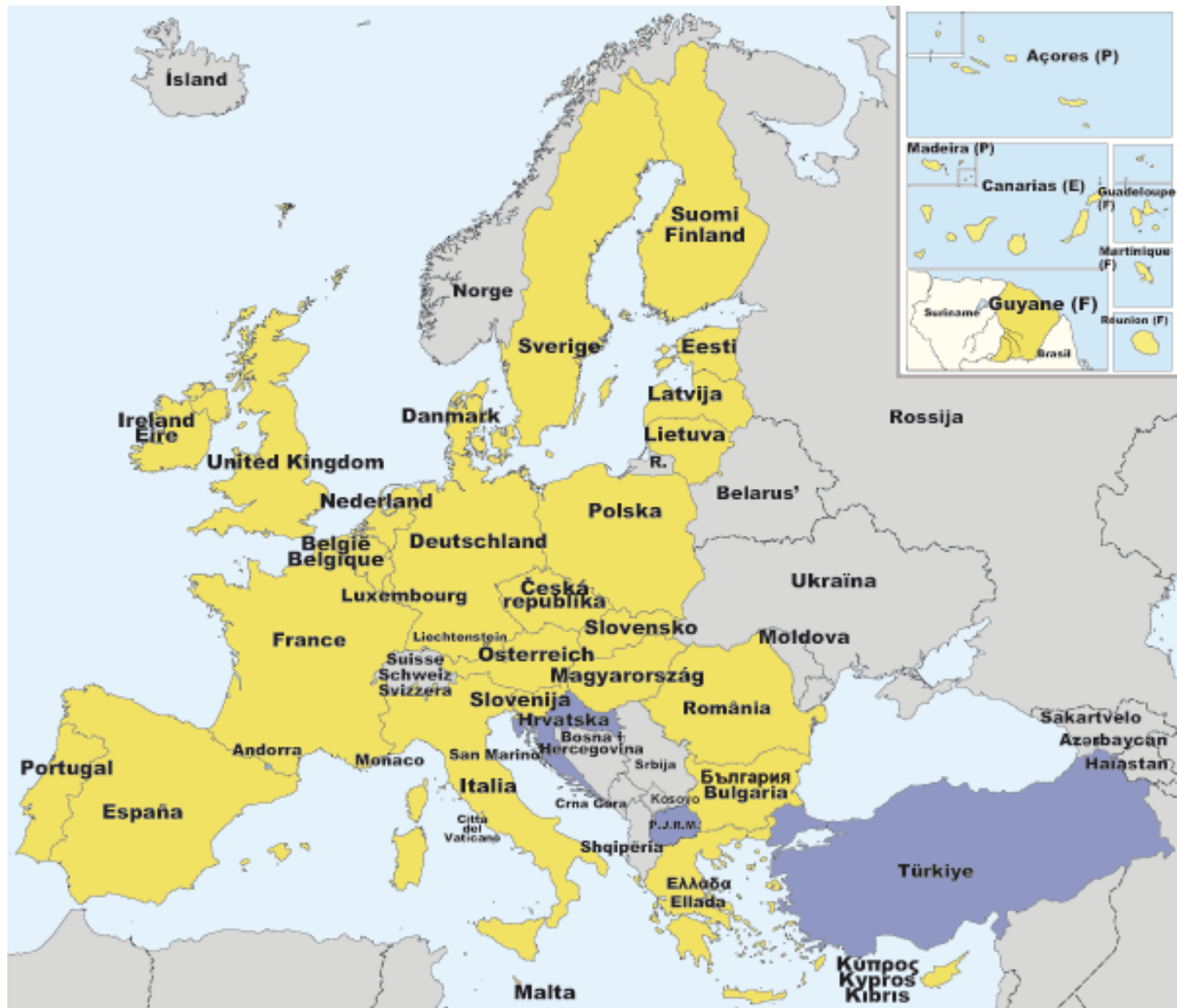
Pays membres de l'UE